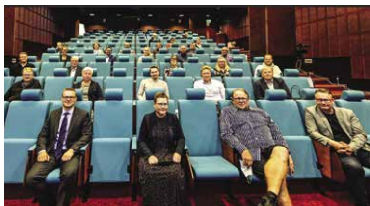
Sotkamon kunnanvaltuusto.

–Ei kukaan järkevä kuvittele, että 4000 ihmisen yrityksessä kaik- ki valta ja päätöksenteko vyöryte- tään ylimpään johtoon. Ei. Yritys jakaa toiminnot sopivan kokoisin yksiköihin ja varmistaa, että jokai- sessa toimipisteessä, Kainuussa ne olisi kunnissa, on vastuullinen johtaja. Edelleen mahdollisimman